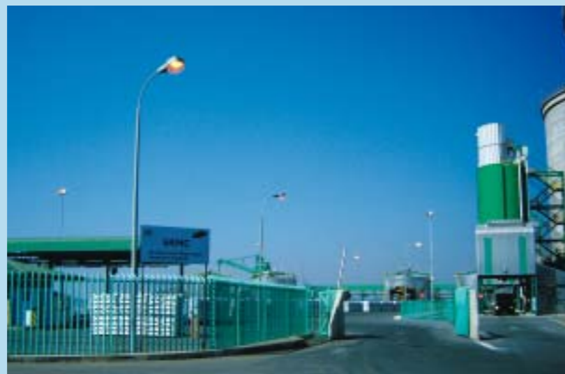
Aluminiumterminal in Mozambique

logistiek beoordeeld, de kwaliteit van diensten en infrastructuur vastgesteld, de toegankelijkheid tot handelsfinanciering besproken en vertegenwoordigers uit de private en publieke sector geïnterviewd. Het model wordt regelmatig bijgewerkt op basis van praktijkervaringen uit zestien landen.